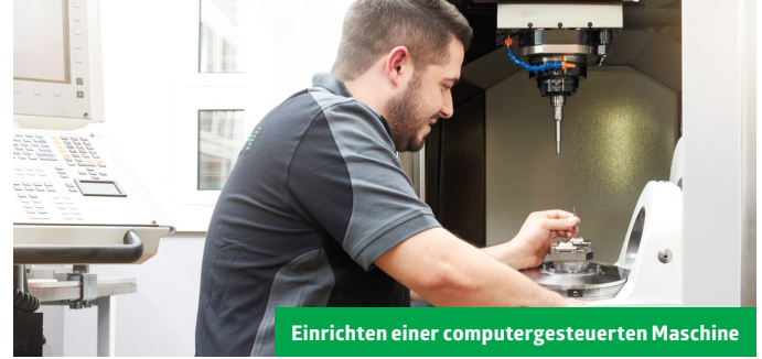
Einrichten einer computergesteuerten Maschine

Polymechanikerinnen und Polymechaniker EFZ fertigen Werkstücke, stellen Werkzeuge und Vorrichtungen für die Produktion her oder bauen Geräte, Apparate, Maschinen oder Anlagen zusammen. Sie bearbeiten Aufträge oder Projekte, oder bauen Prototypen und führen Versuche durch. Sie wirken mit bei Inbetriebnahmen, beim Planen und Überwachen von Produktionsprozessen oder führen kompetent Instandhaltungsarbeiten aus.